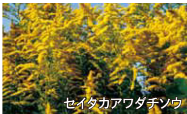
セイタカアワダチソウ